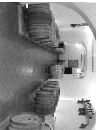
ラ・バルバツツラの熟成室。バルバツツラは5年物の古樽も多く使う。