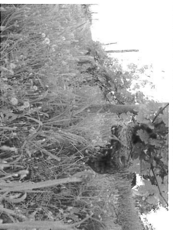
ラ・バルバツツラ、樹齢70年の古木。幹はこの太さ。畑は長年のピオロジックで、自然の野花も多数咲き乱れる。